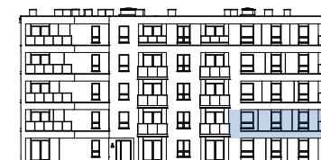
Usytuowanie mieszkania na elewacji

■ Ściana bez możliwości wyburzenia □ Ściana z możliwością wyburzenia/demontażu